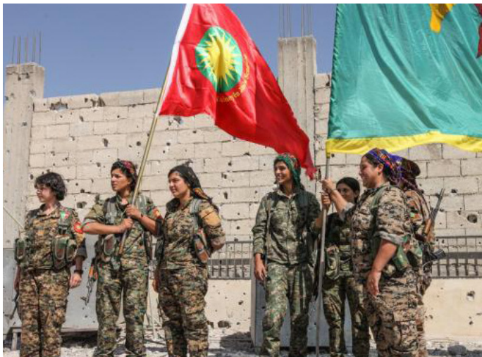
YJŞ i YPJ a Raqqa. Font: greenleft.org.au (23/09/2017)

La campanya per alliberar les dones yazidites va continuar els següents anys, amb l'anomenada «Campanya de la tempesta de Cizire» a Deir-Ez-Zor, en la qual les YPJ van dur a terme un paper fonamental en l'alliberament de més de tres mil dones i infants segrestats d'entre els 6417 yazidites capturats anteriorment. Van ser portades a la Casa Yazidita i a la Comissió de Dones de la província