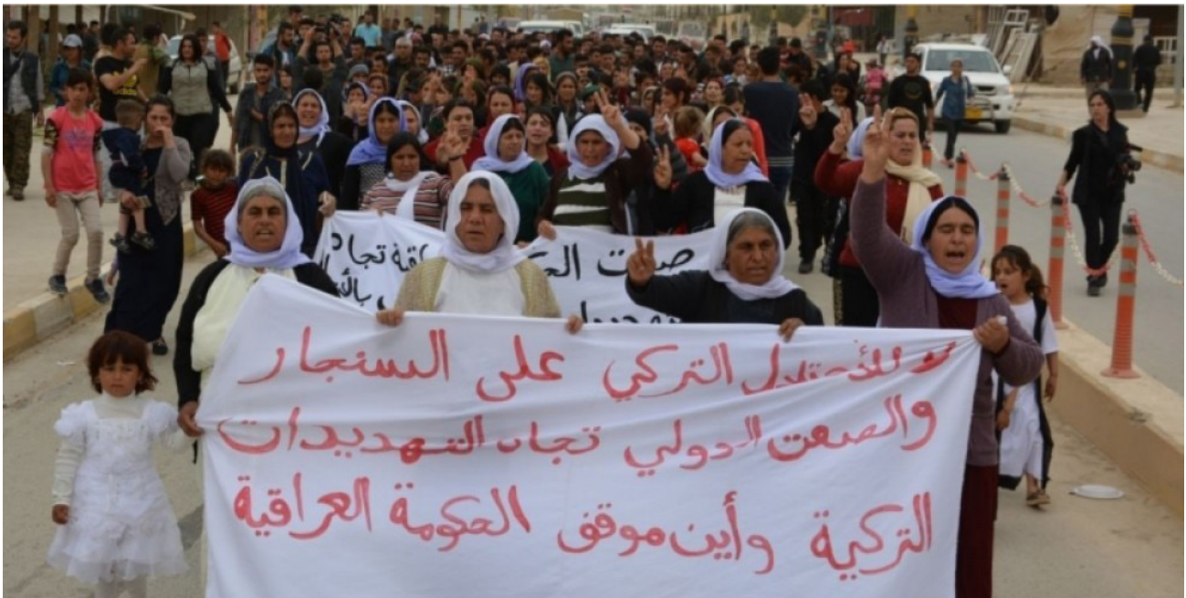
Manifestación de mujeres yazidíes. Fuente: ANF (29/03/2018)