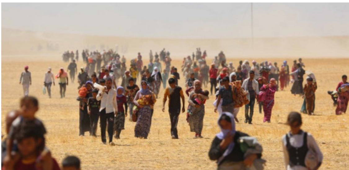
Êzdiyên ku ji Şengal direvin.

Her jinek an keçek Êzîdî gelek caran li bazara Beniyan, dihatin firotin, hem jî ew bidarê zorê ji xwe