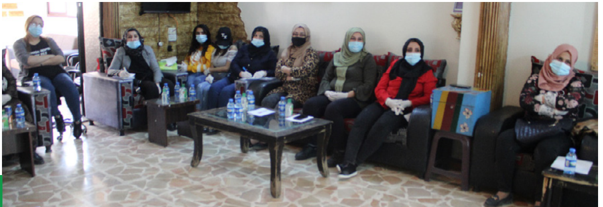
Foto einer internen Bildung der Mala Jin.