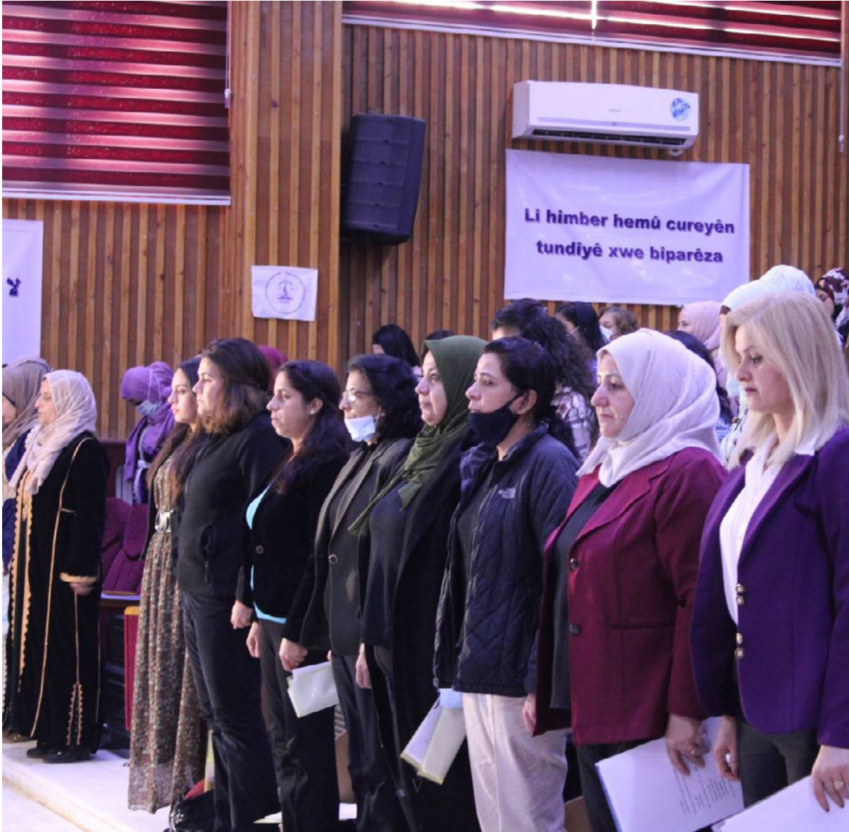
Teilnehmerinnen der Konferenz der Frauenversammlung für soziale Gerechtigkeit - 19 November 2021