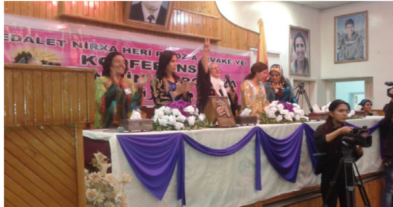
Mala Jin Konferenz 2016

Die Frauenbewegung ist in die Strukturen aller Organisationen der autonomen Verwaltung integriert worden. Die Arbeit hat viele Ziele, je nach den Erfordernissen des Sektors: Schutz von Frauen in Gefahr, Bereitstellung von Bildungsmöglichkeiten, Entwicklung der wirtschaftlichen Unabhängigkeit von Frauen, Auseinandersetzung mit der männlichen und weiblichen Mentalität und vieles mehr. Ein Großteil dieser Arbeiten begann bereits lange vor der Revolution innerhalb der Untergrundbewegung Yekitiya Star. Das erste Mala Jin wurde in Qamishlo noch vor Beginn der Revolution eröffnet, in einer gefährlichen und unsicheren Zeit. Mit dem Ausbruch des Bürgerkriegs im Jahr 2011 verschlechterte sich die Lage der Frauen in der Region weiter. Die Eröffnung eines Mala Jin zu dieser Zeit war eine Chance, aber auch eine Notwendigkeit für die Frauen in der Region.