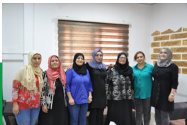
Mitglieder der Mala Jin in Qamischlo

Das erste Mala Jin wurde offiziell am 20. März 2011 in Qamischlo eröffnet. Wie bereits erwähnt, war es das Ergebnis jahrzehntelanger Organisierung kurdischer Frauen im Untergrund, die damit Grundlage schufen, um die vollständige Gleichberechtigung in ihren Familien und Nachbarschaften