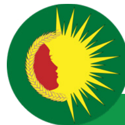
Kongra star Logo