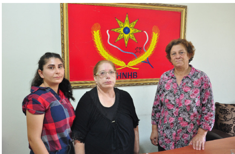
Mitglieder des Assyrischen Mala Jin in Heseke

Dieses Beispiel zeigt, dass die verschiedenen Gemeinschaften in Nord- und Ostsyrien in der Lage sind, ein Projekt wie die Mala Jin zu integrieren, das zum Wohle des Ganzen dient.