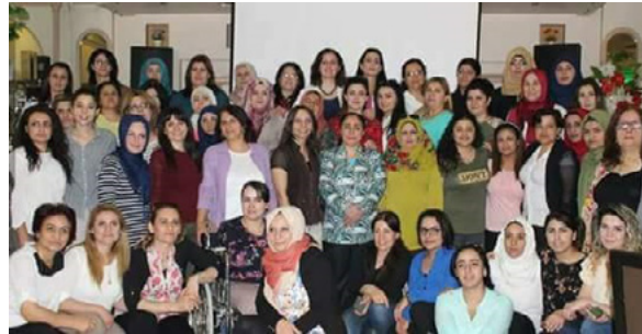
1. Mala Jin Konferenz- 10 October 2016

Seitdem ist die Organisation gewachsen und umfasst nun Frauen aller Ethnien und Religionen. Im Jahr 2016 änderte Yekitiya Star seinen Namen in Kongra Star und wurde zu einer konföderalen Organisation von verschiedenen Frauenstrukturen und -institutionen, die sich bereit erklärt hatten, im Rahmen ihrer Satzung zu arbeiten. Als die arabischen Mehrheitsregionen Manbij, Tabqa, Raqqa und Deir ez Zor vom ISIS befreit und in das Projekt der AANES einbezogen wurden, stellten die arabischen Frauen fest, dass sie einen ähnlichen kulturellen Hintergrund hatten und vor ähn-