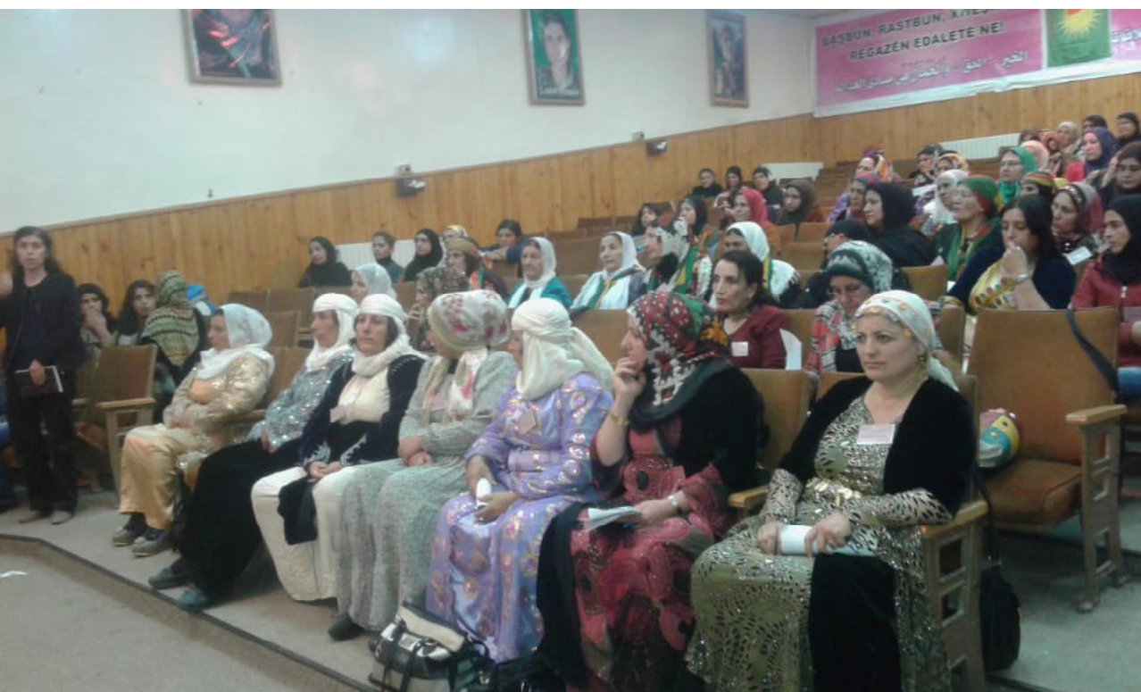
Foto der ersten Mala Jin-Konferenz, am 10. Oktober 2016 unter dem Motto: "Gerechtigkeit ist ein heiliger sozialer Wert." An der Konferenz nahmen 135 Vertreter von Mala Jin aus Cizire, Afrin, Kobani, Damaskus und Manbij teil.

Wie bereits erwähnt, ist das Gericht jedoch auch an der Genehmigung und Einreichung von Einigungsverträgen für viele andere Arten von Fällen beteiligt, z. B. in Scheidungssachen. Das Gericht spricht das offizielle und endgültige Scheidungsurteil aus, aber die Bedingungen der Mediation werden bei den meisten Scheidungen durch das Verfahren der Mala Jin diktiert. Wenn die Schlichtung mit der Mala Jin nicht erfolgreich ist und keine Einigung erzielt werden kann, wird das Soziale Versöhnungskomitee eingeschaltet. Scheitert die Schlichtung erneut, wird das Gericht den Fall übernehmen, um die Scheidung zu regeln. .