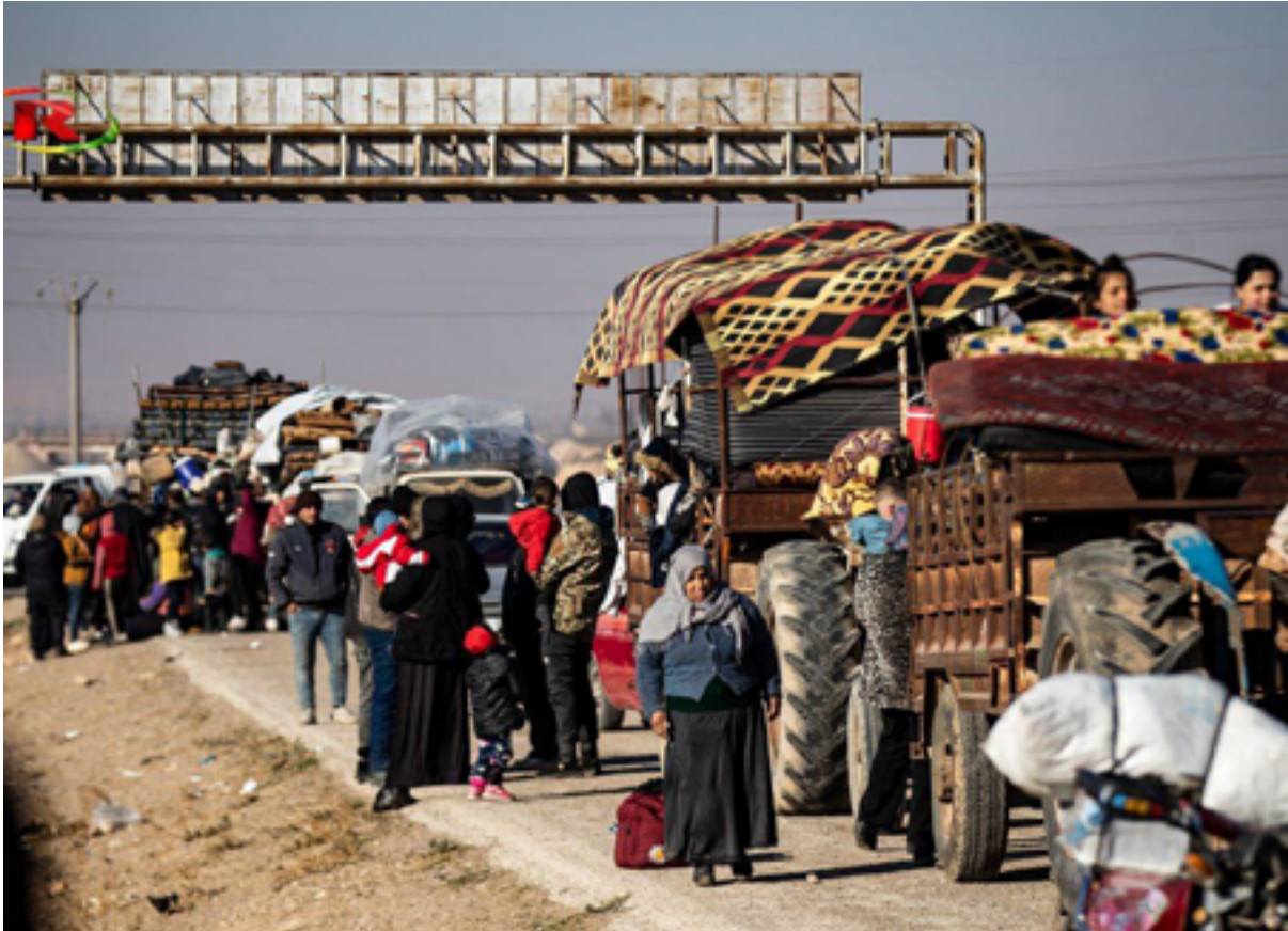
Geflüchtete die von Shehba in die Regionen der AANES laufen/ Deyember 4

Ebenso wie sie durch die harten Bedingungen der Unterkunft und Verpflegung in den kalten Wintermonaten besonders gefährdet sind, sind Tausende von Kindern, Mädchen und Frauen unter diesen Umständen auch von geschlechtsspezifischer Gewalt bedroht.