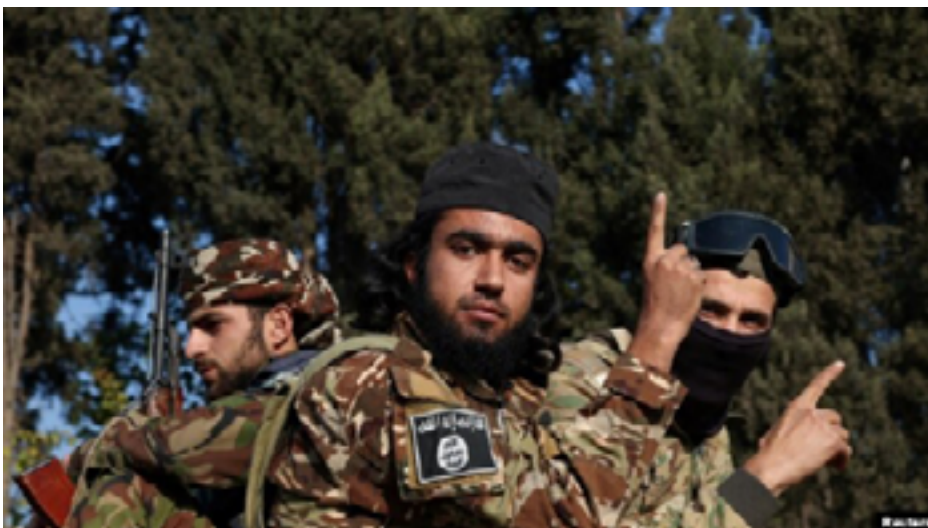
HTS-Kämpfer fahren in einem Fahrzeug, nachdem sie Damaskus eingenommen und Präsident Bashar al-Assad in Syrien gestürzt haben. 9. Dezember 2024, Mohamed Azakir/Reuters

Trotz ihres gemäßigten öffentlichen Erscheinungsbildes - das strategisch genutzt wird, um internationale Unterstützung und Anerkennung zu erreichen - teilt das HTS weiterhin viele der radikalen Ideologien von Al-Qaida. Sie erhält weiterhin Unterstützung von ausländischen Akteuren, einschließlich der Türkei, obwohl in mehreren Berichten auf die Verwicklung des HTS in Menschenrechtsverletzungen hingewiesen wird. Nach wie vor ist ihre Verbindung zu anderen dschihadistischen Gruppen sowohl für die regionalen als auch für die internationalen Mächte besorgniserregend. Dies ist insbesondere anhand von Bildern und Beiträgen aus der Region in sozialen Medien sowie Berichten von politischen und humanitären Organisationen vor Ort nachzuvollziehen.