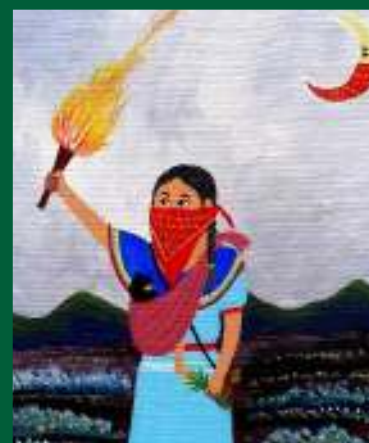
Manifestació de les dones de Sepur Zarco