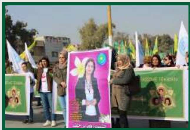
Manifestació a Heseke en el Dia Internacional Contra la Violència Maclista