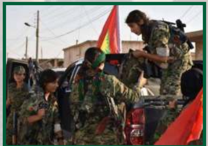
Combatents de les YJŞ