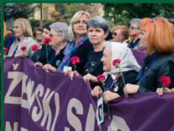
Manifestació a Sarajevo