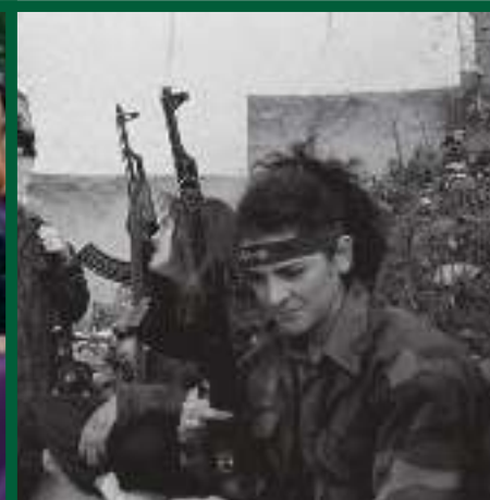
Dones bòsnies a la resistència