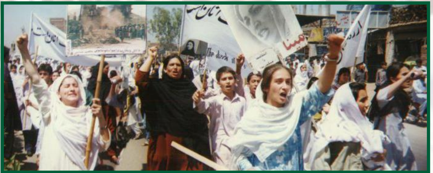
Manifestació de la RAWA el 1998

A Afganistan hi trobem la mateixa història. Va ser ocupat pels soviètics el 1979 i pels EEUU el 2001. Segons informes internacionals, les forces d'ocupació van violar centenars de dones, van obligar les dones a actuar en pornografia i van vendre dones afganes a traficants de persones d'altres països. La tradició de resistència de les dones a Afganistan, que s'ha convertit en un camp de batalla pels estats imperialistes que competeixen pel poder, es remunta a molts anys d'història: les dones van fundar l'Associació Revolucionària de les Dones d'Afganistan (RAWA) el 1977 contra l'ocupació i la violència religiosa patriarcal. La RAWA segueix mantenint la seva resistència de base i representa l'autodefensa de les dones al país conjuntament amb altres organitzacions de dones.