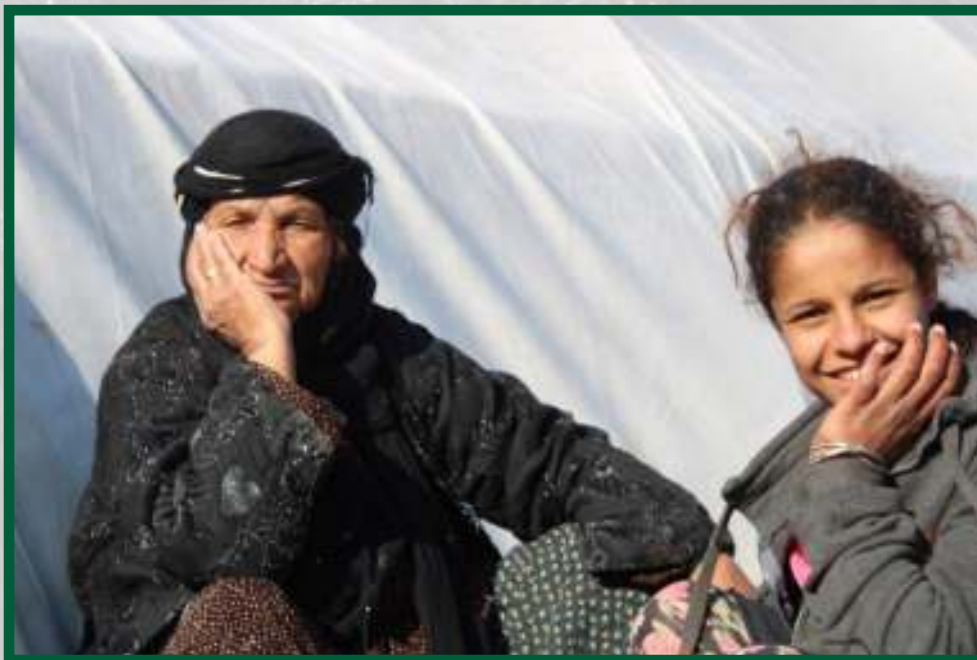
Refugiades de Serêkaniyê al camp Washokanî

Cada dia es publiquen informes sobre crims de guerra contra dones i sobre violència de gènere a les ciutats ocupades. Segons les dades rebudes per l'Organització de Drets Humans de la Regió de Cizire, moltes dones van ser segrestades a les regions de Serêkaniyê i Girê Spî i les dones de la ciutat van ser obligades a portar niqabs negres.