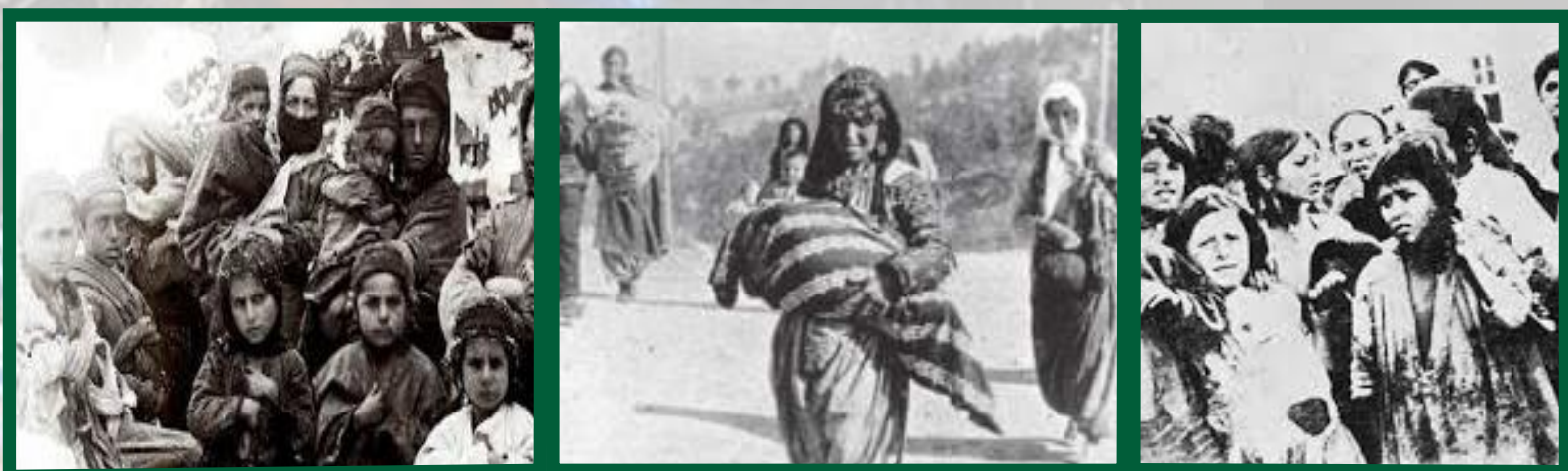
Armènies fugint del genocidi