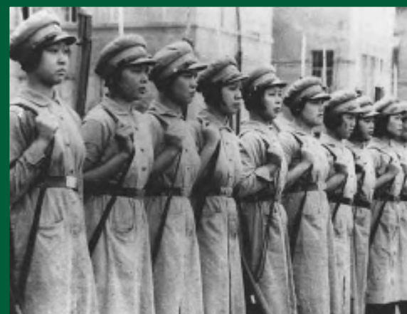
Forces de dones xineses

Les dones coreanes, taiwaneses i xineses van formar unitats d'autodefensa per resistir l'ocupació japonesa. La presència de més d'un centenar d'unitats d'autodefensa als pobles formades per dones a la Xina durant aquest període mostra la magnitud de la resistència de les dones.