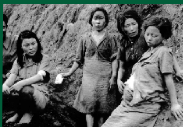
Dones sud-coreanes que van patir esclavitud sexual