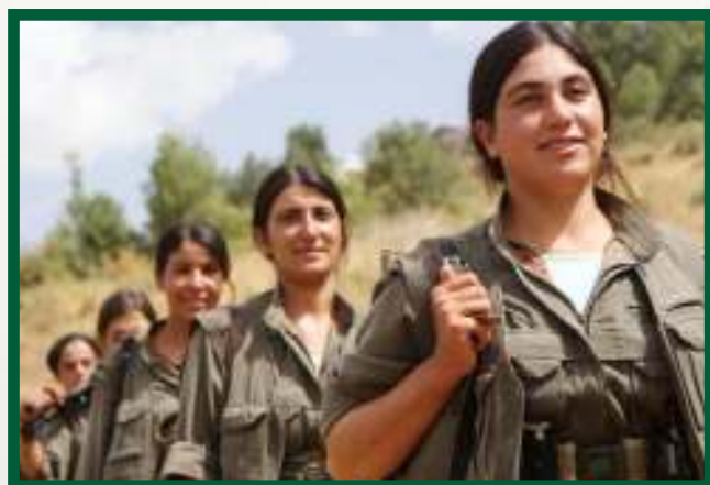
Combatents de les YJA-Star

Les dones han de ser la base de les organitzacions socials i comunitàries que poden unir-se en un sistema confederal. Les dones han d'ocupar un lloc central en tots els processos de negociació, diplomàtics i de pau, amb la