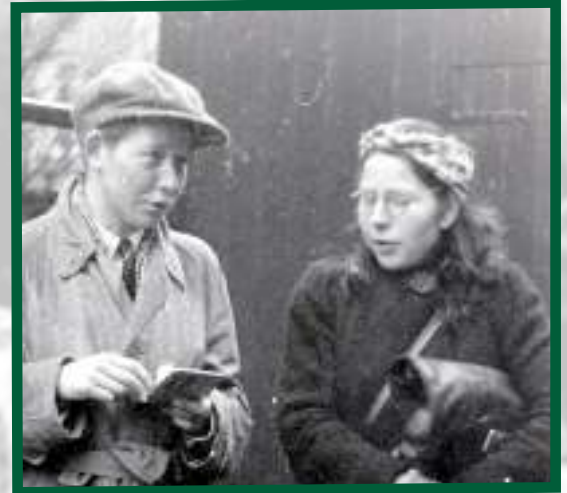
Truss Oversteegen i Hannie Schaft