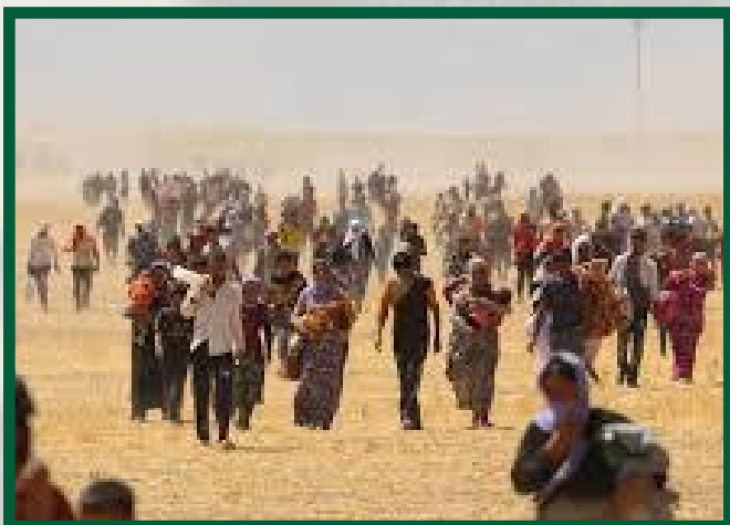
La gent de Sinjar fugint d'ISIS el 2014