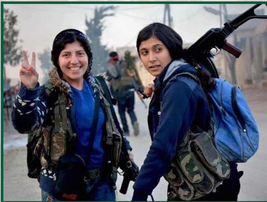
Combatents de les YPJ a Afrîn

Segons l'Organització de Drets Humans d'Afrîn, hi ha hagut atacs sistemàtics contra dones i nenes. Es descobreix el destí de milers de dones segrestades per l'anomenada "policia militar" recolzada per l'Estat turc. Algunes de les dones segrestades van ser alliberades després del pagament d'un rescat.