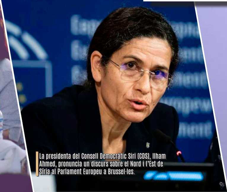
La presidenta del Consell Democràtic Siri (CDS), Ilham Ahmed, pronuncia un discurs sobre el Nord i l’Est de Síria al Parlament Europeu a Brussel·les.