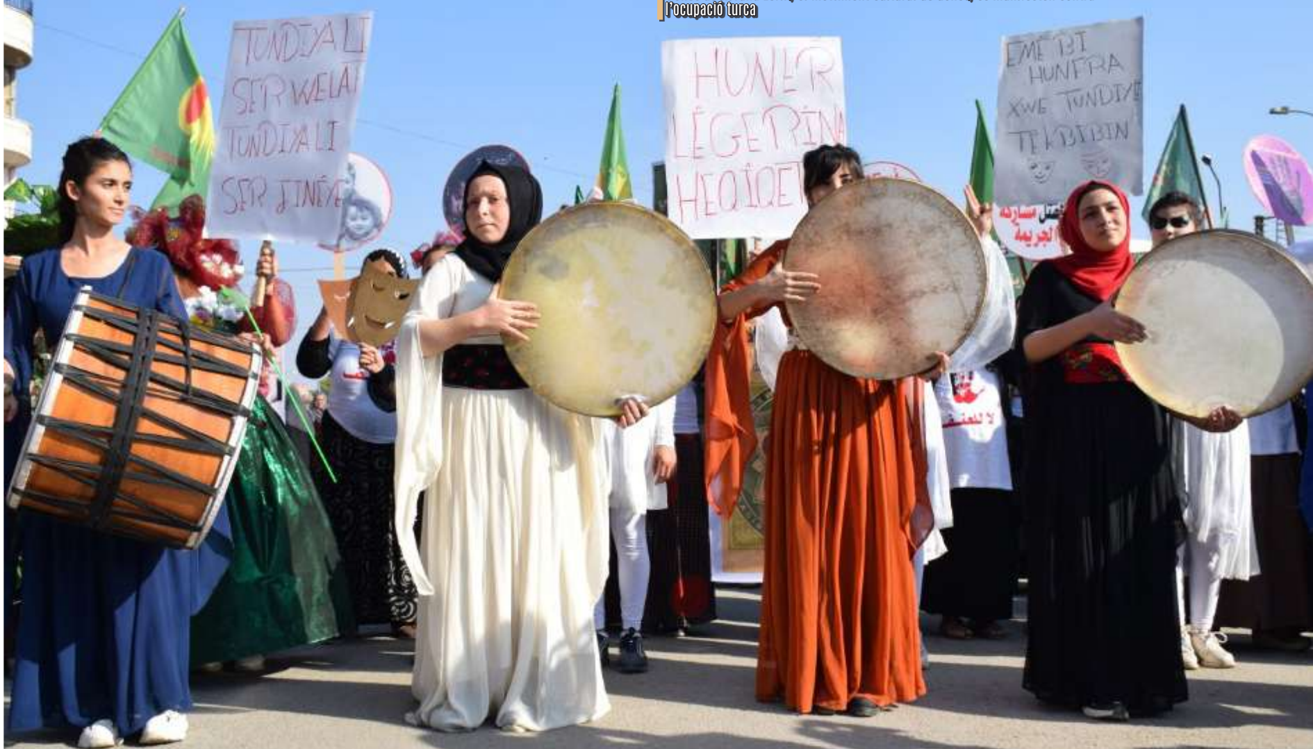
Dones de Kevana Zerîn, el moviment cultural de dones, es manifesten contra l'ocupació turca