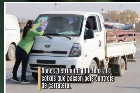
Dones distribuïnt fulletons als cotxes que passen pels controls de carretera.

La Civin veu la campanya com una forma de participació de persones de tot el món: «Veiem