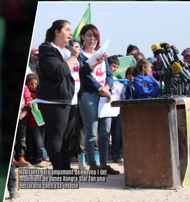
Habitants del campament de Tweyna i del moviment de dones Kongra Star fan una declaració contra la invasió

3 Heyva Sor: Invasió de grups islàmics i militars turcs al Nord i l'Est de Síria , 14.11.2019, p.1..