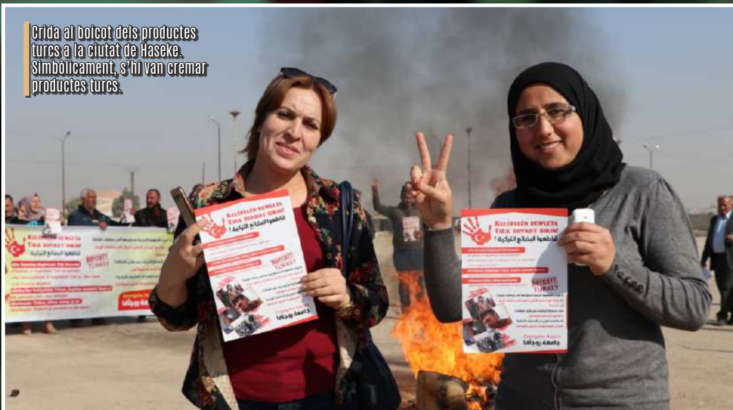
Crida al boicot dels productes turcs a la ciutat de Haseke. Simbòlicament, s'hi van cremar productes turcs.

la campanya a nivell internacional. A Europa, sigui on sigui que hi hagi kurds i amics dels kurds, i a tot el món àrab, també hi donen un gran recolzament. Sigui on sigui que ens trobem podem posar un límit a l'economia de Turquia. Sigui on sigui que es trobin les dones, no només aquí, poden desenvolupar un paper en aquesta resistència».