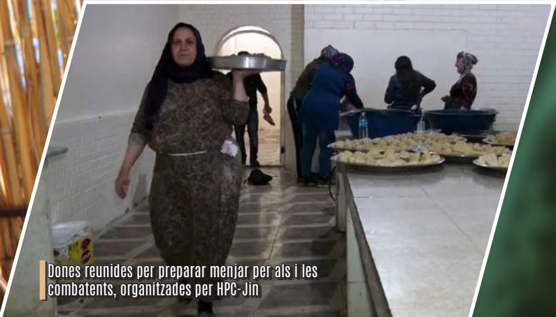
Dones reunides per preparar menjar per als i les combatents, organitzades per HPG-Jin